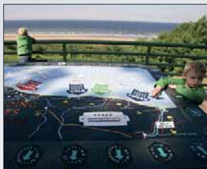
▲ Operace Overlord – největší vojenská invazní akce všech dob. Od rozkazu generála Dwighta Eisenhowera (vlevo nahoře) po dobytí německých obranných pevností (vpravo dole). ■ Po půlstoletí normandské pláže navštěvují váleční veteráni i nové generace.