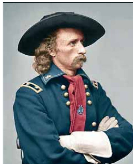
■ Ve své době byl ješitný Custer považován za neodolatelného krasavce. Není divu, že po jeho boku nechyběla ani indiánská milenka.