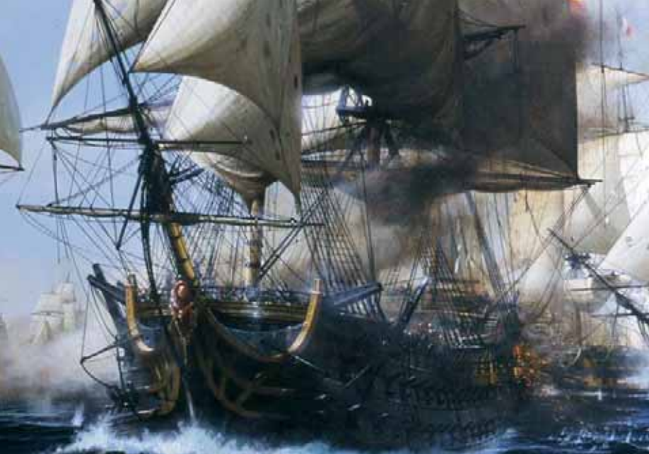
■ HMS Victory (HMS – loď Jeho Veličenstva) vplouvá do nepřátelské linie.