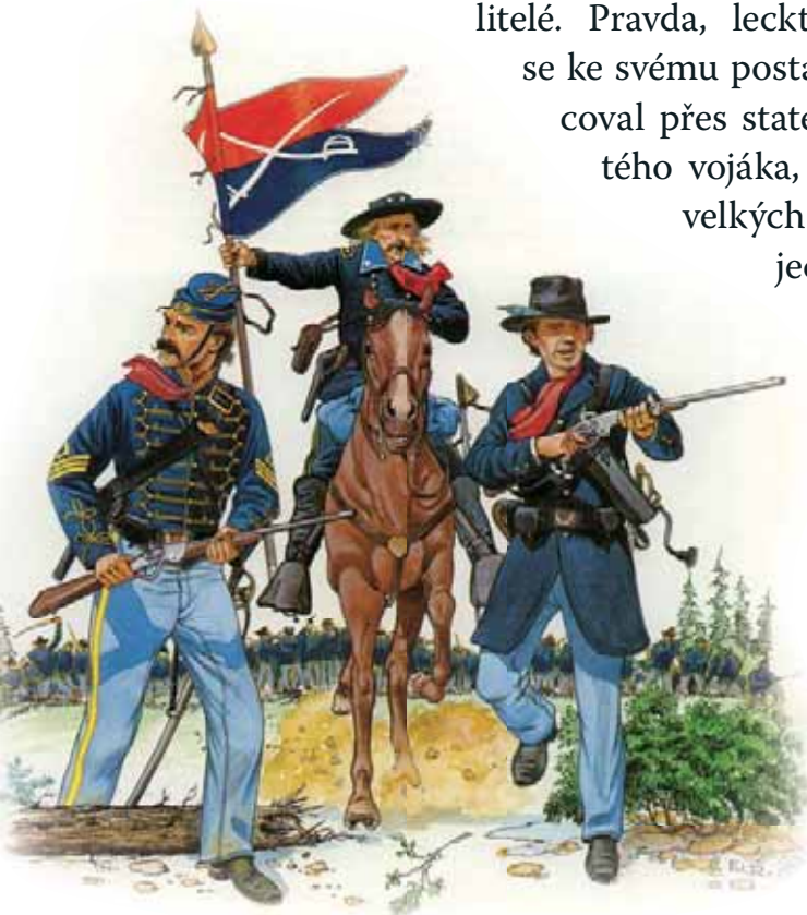
■ Sebevědomý Custer vyráží vstříc svému osudu.

rál George Armstrong Custer (1839–1876). Budoucí americký hrdina je přesně tím mužem, o němž se praví, že je „rozporuplnou osobností“. To znamená, že tak jako jím může někdo pohrdat a odsuzovat jej, tak má i tisíce obdivovatelů. Byl přesně typem vojáka, který hodlá vyniknout a získat slávu za každou cenu. Před pár stovkami let by patrně patřil mezi slavné dobrodruhy a válečníky, ale v 19. století už byl přežitkem. Jeho vojenská kariéra začala na bojištích americké občanské války. Ta vlastně jeho vytouženou vojenskou kariéru zachránila. Mezi studenty důstojnické školy byl beznadějně poslední, vadila především jeho