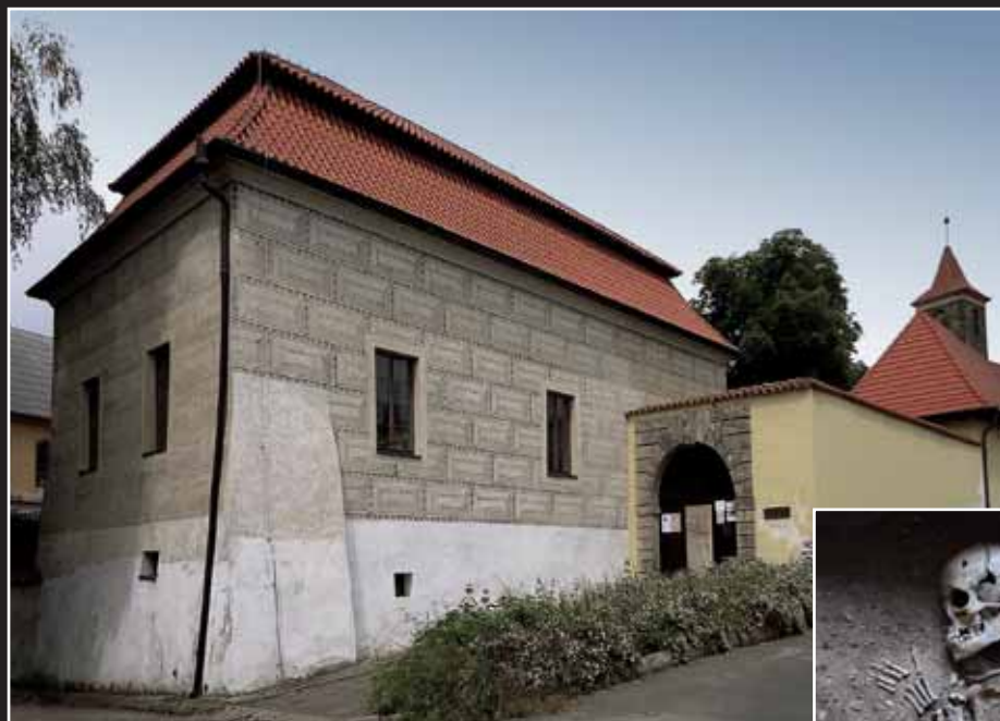
Čelákovická tvrz a románský kostel svědčí o stáří města. Upíří pohřebiště leželo nedaleko tohoto jádra slovanského osídlení.