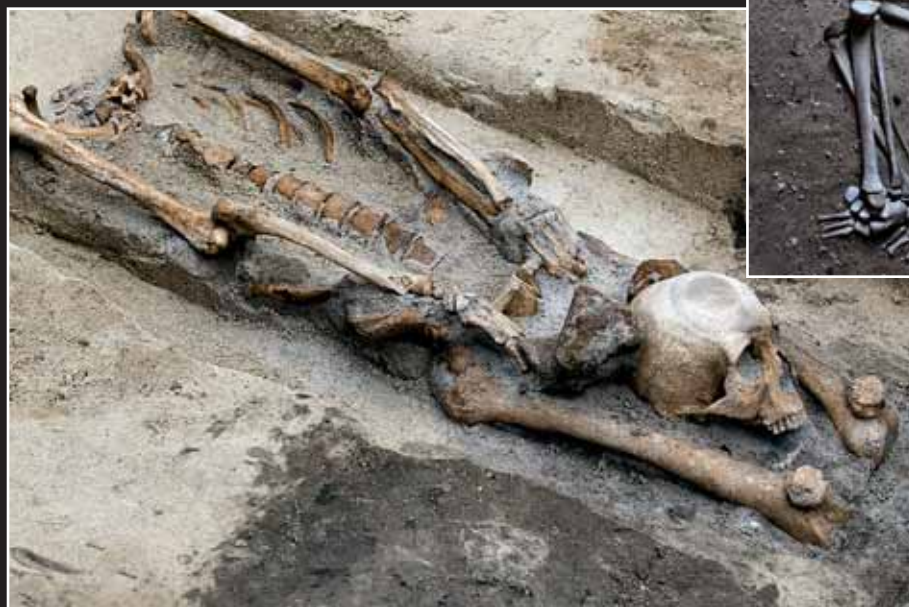
Podle neobvyklého uložení těl a stop po ochranných opatřeních byl v jednom z čelákovických pohřebišť identifikován hřbitov upírů. S dvaceti pohřbenými těly patří k největším, protože jinde jde obvykle o ojedinělé pohřby.