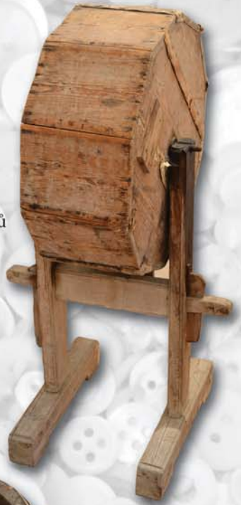
Soudek na leštění knoflíků