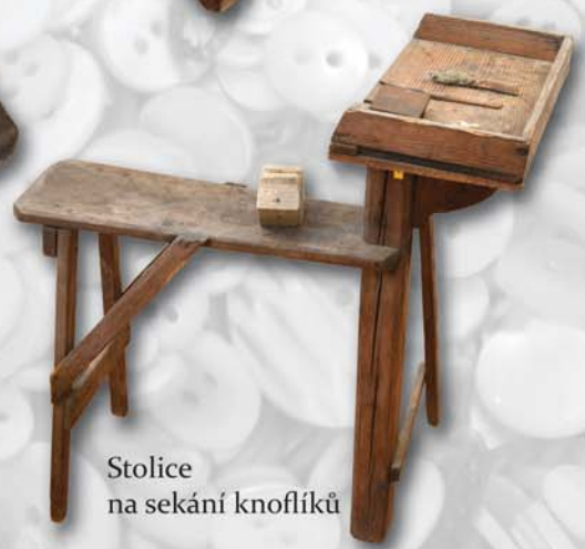
Stolice na sekání knoflíků