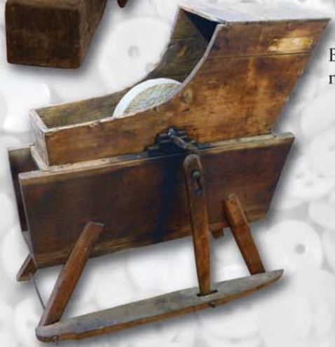
Brus na ostření nářadí