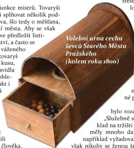
Volební urna cechu ševců Starého Města Pražského (kolem roku 1800)

Statuta obvykle stanovovala maximální počet tovaryšů, který směl mistr zaměstnávat, obsahovala článek zakazující přetahování zákazníků, a všeobecně též platilo, že do dílny nesměl být přijat