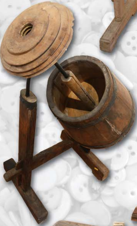
šrupování = = rovnání a hlazení knoflíků